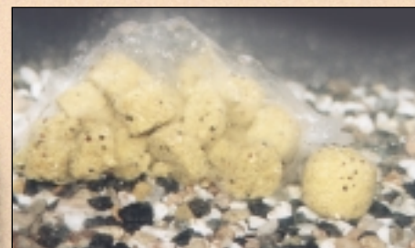
Dvě minuty po nahození se PVA sáček začne rozpouštět a pelety postupně vytváří kolem boilie mrak (kulička boilie zcela vpravo dole).

Hodně úspěchů u vody Vám přeje Zdeněk PRAJS.