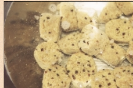
Vysušené pelety po vhození do čisté vody začnou uvolňovat drobné kousičky, zrnka řepky a aroma do okolí.

suším až 5 dní, aby byly úplně tvrdé. Pak je uschovám do nádoby proti molům a jiným vetřelcům. Pokud se chcete přesvědčit o výsledku své práce, vhodte několik kousků do nádoby s čistou vodou a změřte si dobu rozpadu. Přidáním či ubráním