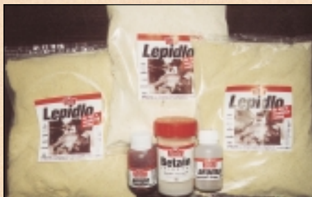
Lepidlo můžete použít v přírodní kukuřičné příchuti nebo ochucené na jahodu, scopex, anýz či meruňku.

Nejprve si připravte suchou směs a všechny ingredience. Do suché směsi přidejte Lepidlo do těst - Chytil v těchto poměrech: do mléčných a sladkých směsí přidejte tolik lepidla, aby tvořilo 20 až 25 % základní směsi. Použijete-li směs na bázi rybích a